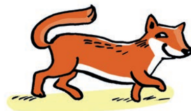
Illustration: Liliane Oser