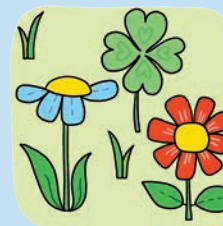
Illustration: Mascha Greune