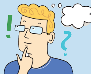
Illustration: Mascha Greune