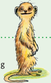
Illustration: Marine Ludin