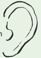
Illustration: Marine Ludin