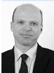
Robert J. Parr