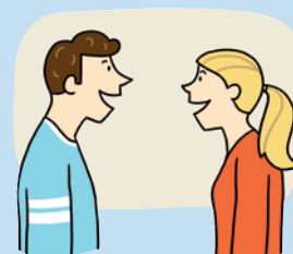
Illustration: Mascha Greune