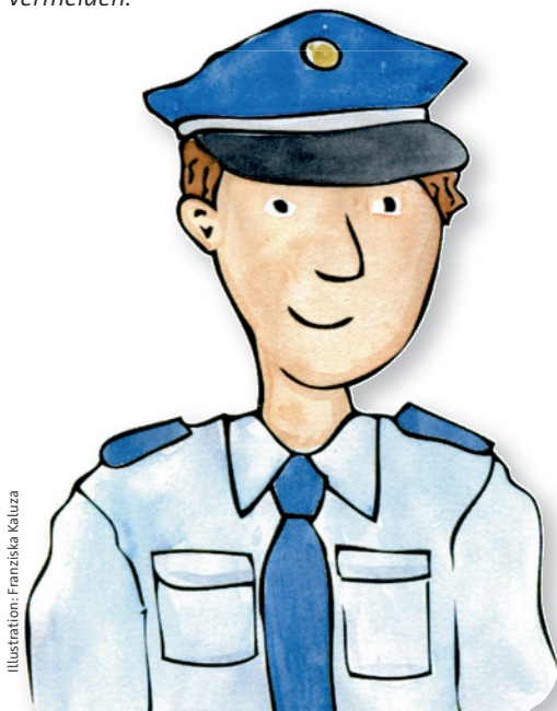
Illustration: Franziska Kaluza

16 Die Arbeit mit einem gut und korrekt strukturierten Grundwortschatz hilft, Fehlschreibungen zu vermeiden.