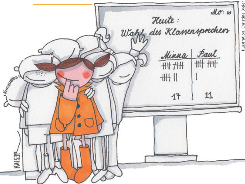
Illustration: Christine Breier

25 Zusammen leben in unserem Land – mitentscheiden: Die Wahl des Klassensprechers ist ein demokratischer Vorgang, bei dem alle Schülerinnen und Schüler lernen, ihre Schule als öffentlichen Raum zu begreifen und an seiner Gestaltung aktiv mitzuwirken.